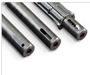
Different front attachment available Unterschiedliche Spindelseitige Aufnahmen

Außergewöhnliches und innovatives Design Kompakte Einbaumaße Integrierte Endlagenschalter